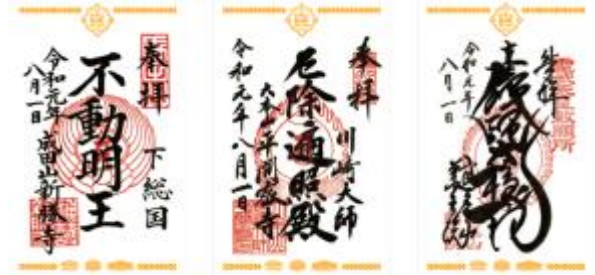
大本山重ね捺しスタンプオリジナル御朱印台紙 (イメージ)

各寺院の受付で、リーフレットをご提示いただき、御朱印料をお納めいただくと「大本山重ね捺しスタンプオリジナル御朱印台紙」に御朱印を受けることができます。