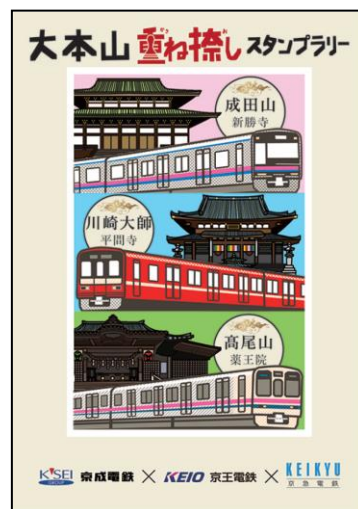
重ね捺しスタンプ（完成イメージ）