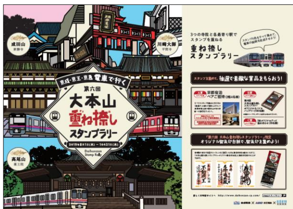
ポスター（イメージ）